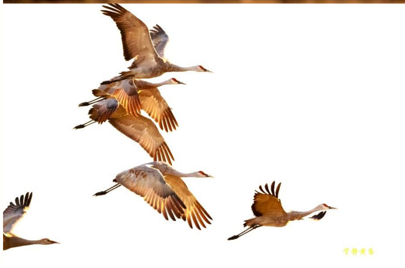
图 8-10 飞翔中的沙丘鹤。