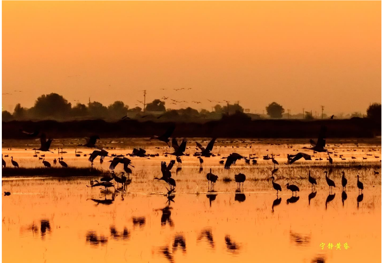
图1 清晨，朝阳刚刚映红天边，沙丘鹤们便开始活动。

北加州木桥生态保护区(Woodbridge Ecological Reserve)是观赏沙丘鹤(Sandhill Crane)绝佳地点。每年深秋到来年初春，沙丘鹤从便会从阿拉斯加和加拿大等地来此过冬。数量从几千到几万只。沙丘鹤们在保护区浅水区里过夜及在周边的水稻田/玉米地觅食和在草地里游戏。各地游客来到木桥观赏沙丘鹤在大自然的舞台上演绎璀璨鹤生。