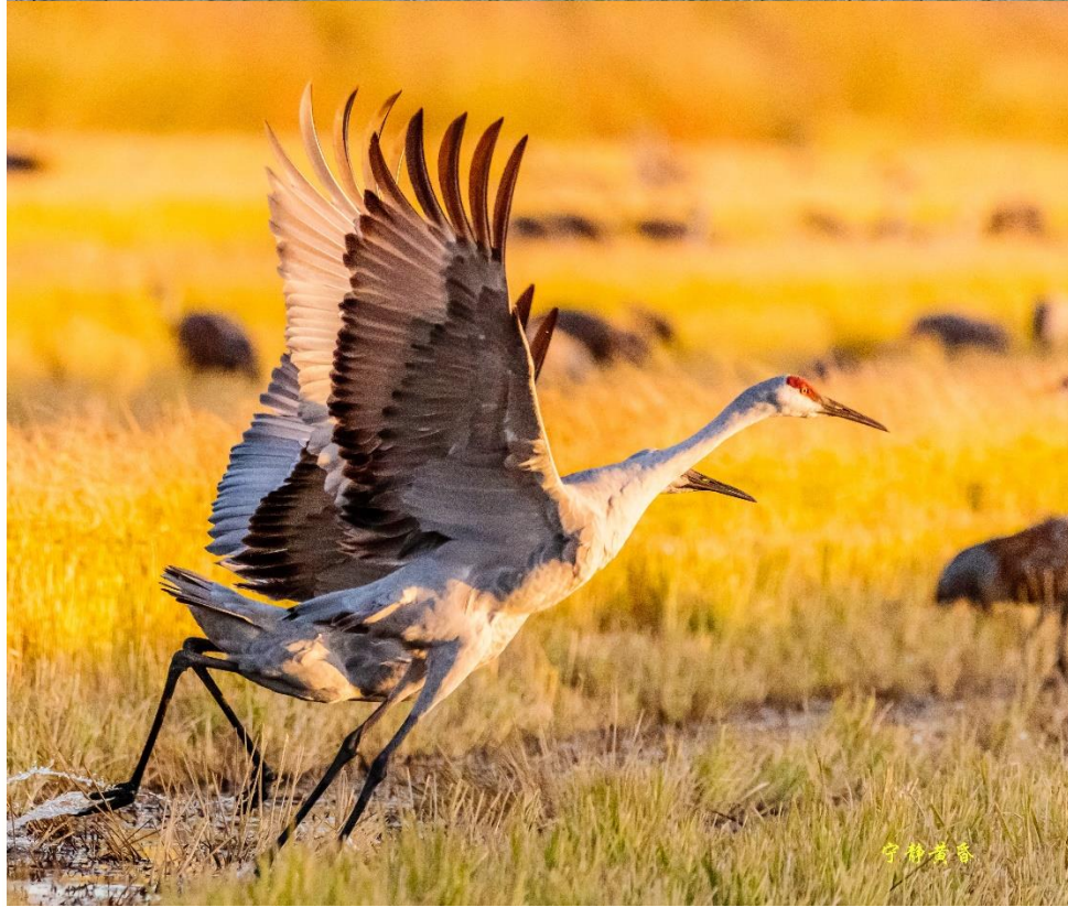
图 6-7 鹤需要助跑方能起飞。