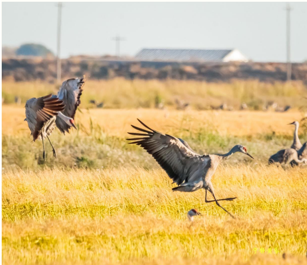
图 11-12 沙丘鹤降落到水稻田中。