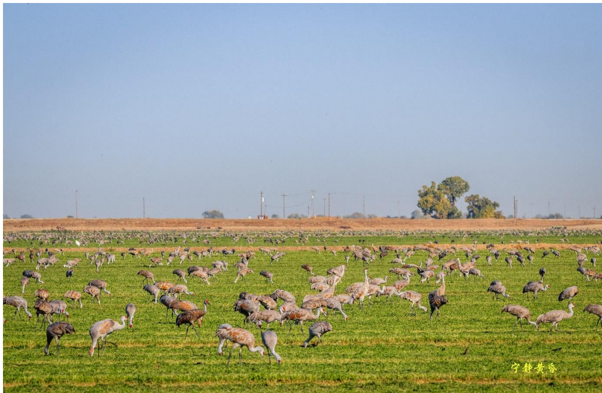
图 2 他们来到草地，寻找着什么。