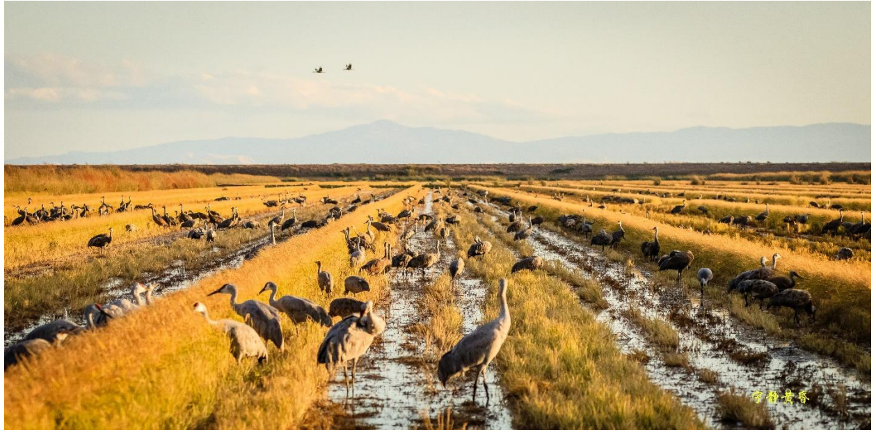
图 13 稻农有意留下一行行稻子供鹤食用。