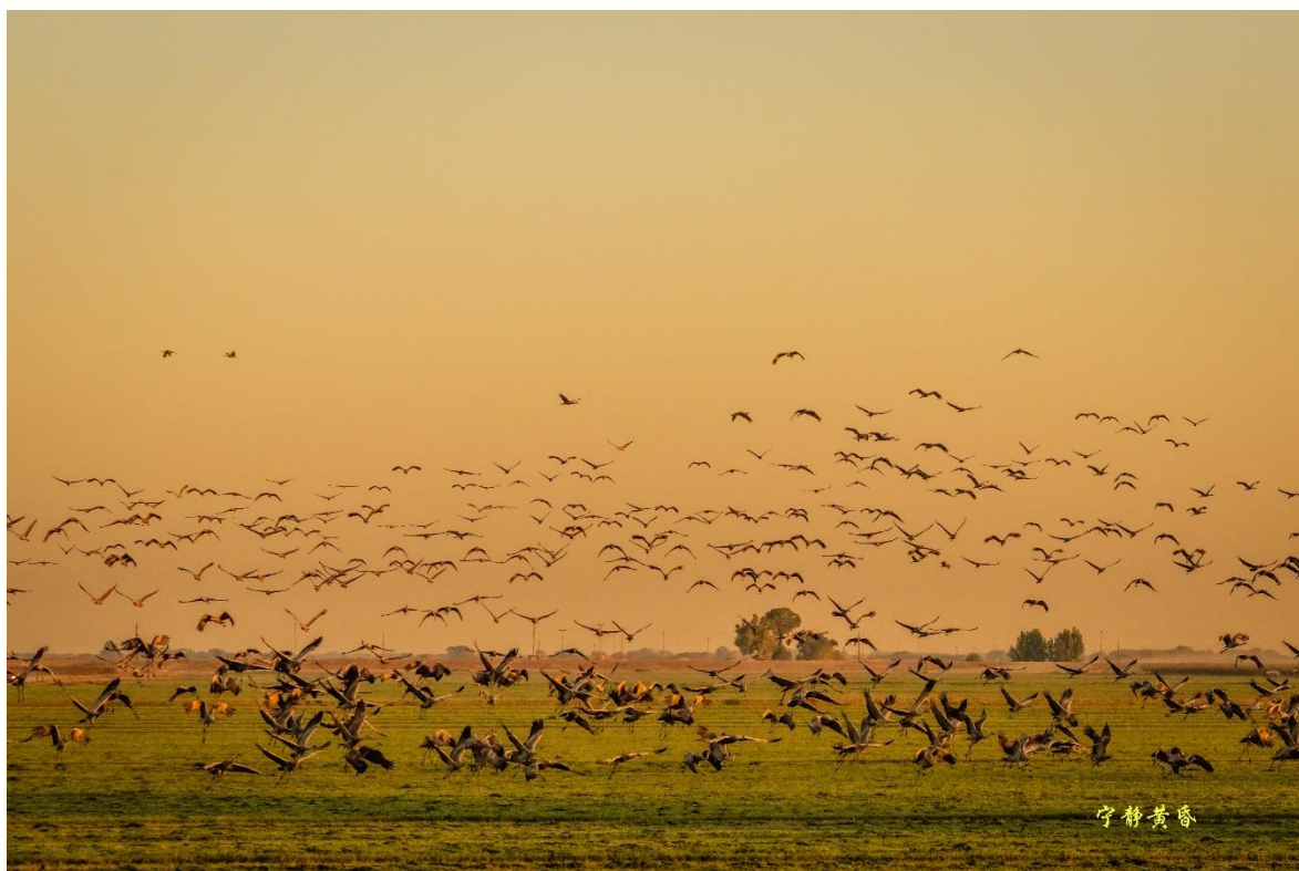
图 5 然后，靠近我们的鹤也飞了起来。甚为壮观。