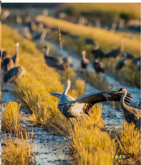
图 19-20 最精彩的是稻草舞，一只鹤跳起将稻草抛向空中，然后蹲下等待降落的稻草。