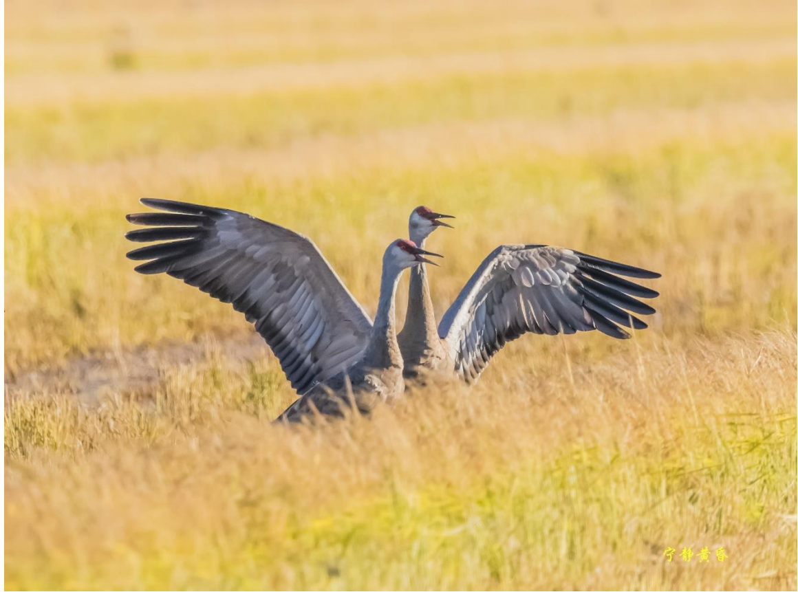
图 27 这是二重唱。