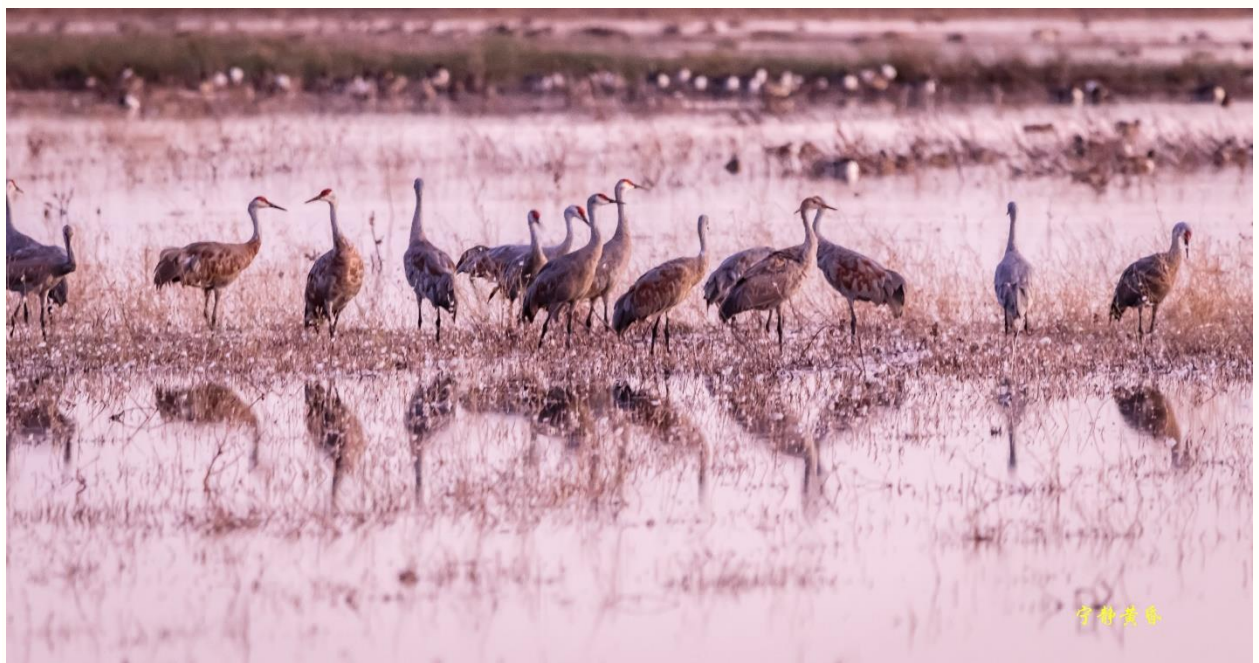
图 31 在保护区浅水区过夜。