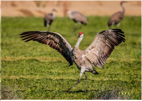
图 16-19 吃饱了，沙丘鹤开始表演。一些鹤喜欢独舞。