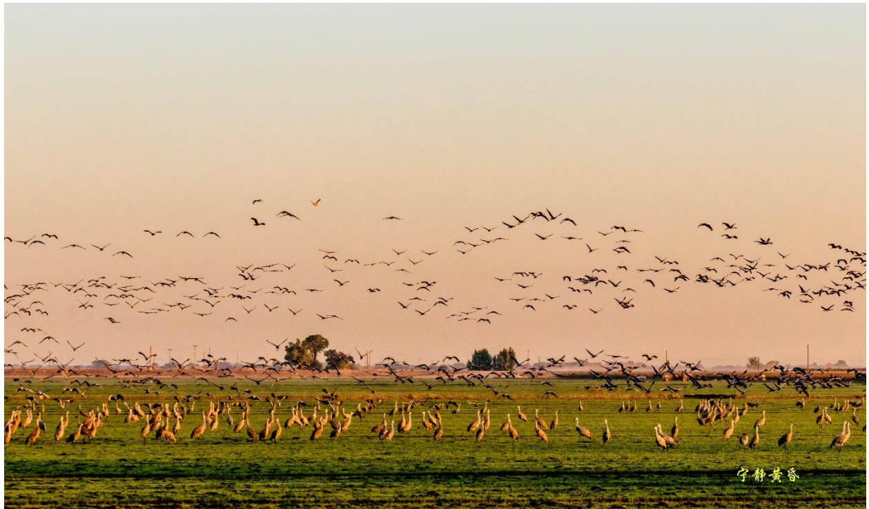
图 4 远处的鹤飞了起来。