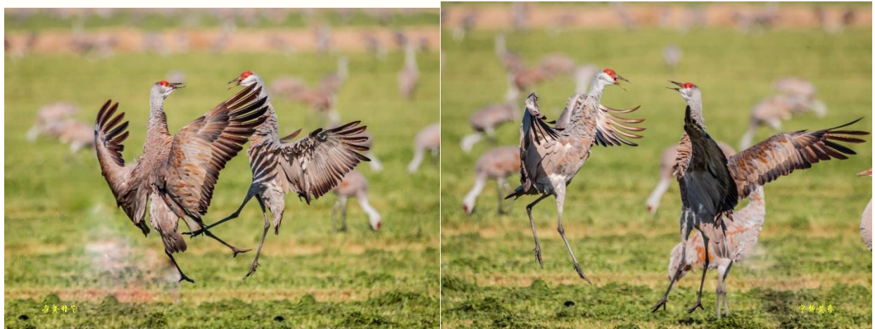
图 21-24 另一些沙丘鹤喜欢双鸟舞。