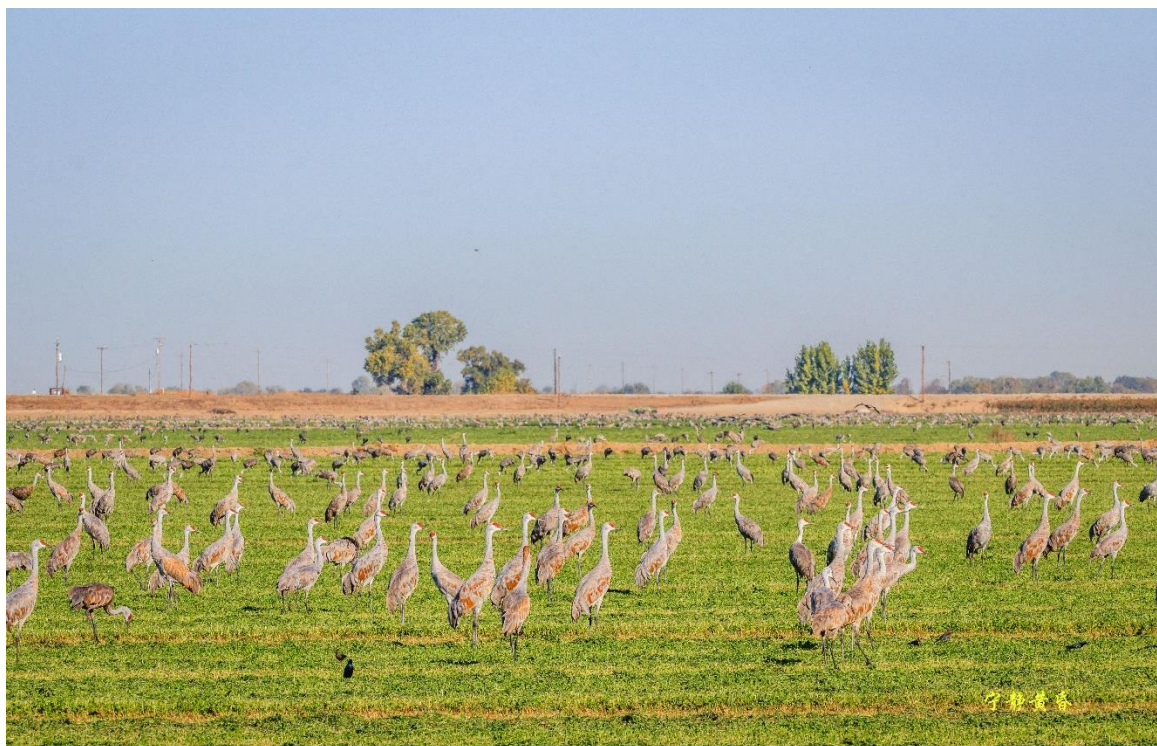
图 3 突然，鹤们抬起头。