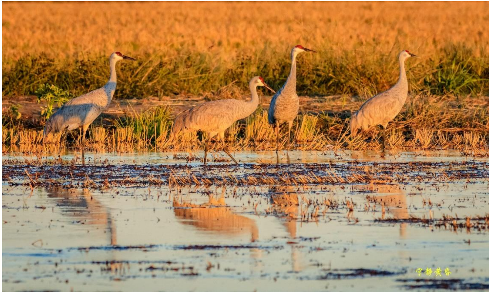
图 29 傍晚，太阳西斜，金色的阳光洒在沙丘鹤身上。