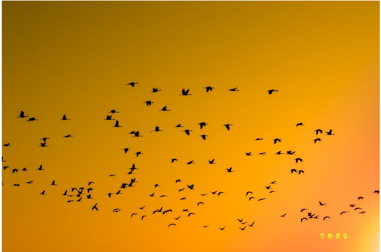
图 30 沙丘鹤伴随夕阳的余光，飞回保护区，