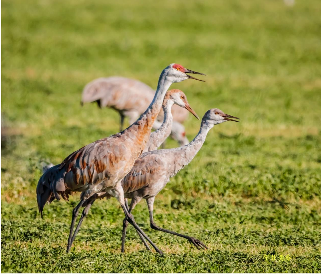
图 28 这是三重唱。场场精彩。