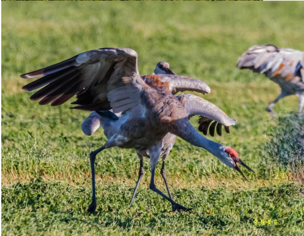
图 25-26 还有演唱。这是独唱。